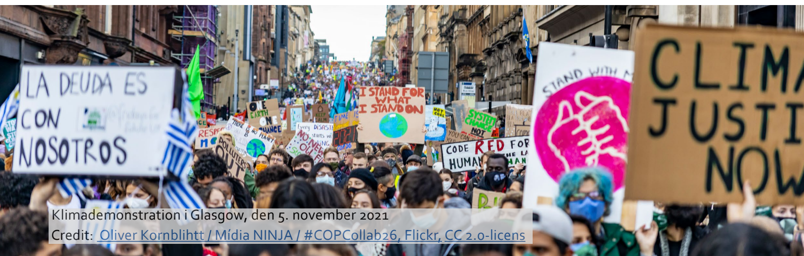
Klimademonstration i Glasgow, den 5. november 2021

I bund og grund fungerer køn som en konceptuel ramme, der afgrænser de roller, den adfærd og de muligheder, der anses for passende for personer, der identificeres som 'kvinder' og 'mænd' eller et andet køn. Sammenhængen mellem køn og klimaforandring er først for nylig blevet anerkendt som et særskilt forskningsområde. I 1988 udkom et banebrydende