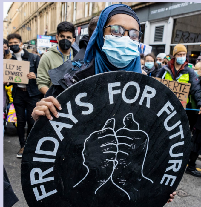
Klimademonstration i Glasgow, den 5. november 2021.