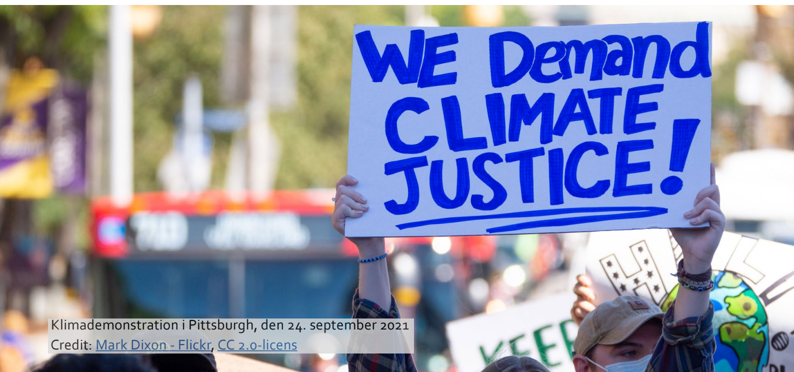
Klimademonstration i Pittsburgh, den 24. september 2021 Credit: Mark Dixon - Flickr , CC 2.0-licens

Nyere forskning tyder på et perspektivskifte i forhold til kønsrelaterede sårbarheder i forbindelse med klimakrisen. I stedet for udelukkende at undersøge de direkte effekter af klimaet på kønsrelaterede sårbarheder bør