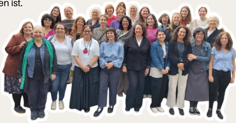
COPGendered Gruppe in Brüssel

Das COPgendered Projekt legt einen Schwerpunkt auf methodische Zugänge für Erwachsenenbildung . Entstanden sind im Laufe der drei Jahre thematische Briefing-Papers, ein E-Learning Kurs zu „Gender and Climate Justice“ und eine Workshop-Methodensammlung entstanden. Begleitend zum (als Selbstlern-Kurs) konzipierten E-Learning wurde eine Webinarreihe zu den Themenschwerpunkten angeboten, zu denen WIDE Österreich Referent*innen aus dem Netzwerk vermittelt hat. WIDE wird die gemeinsam erarbeiteten Bildungsmaterialien weiterverwenden, teilweise ergänzen und ins Deutsche übersetzen. Das COPgendered-Projekt hat das Engagement von WIDE zu Gender- und Klimagerechtigkeit relativ gut öffentlich sichtbar gemacht und zur Nominierung von WIDE in das zivilgesellschaftliche „Sounding Board“ des Wiener Klimarats geführt, in dem WIDE nunmehr vertreten ist.