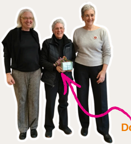
Dora Maria Telléz

Unter anderem konnte WIDE Dora Maria Telléz einladen und mit ihr nicht nur auf der Entwicklungstagung einen gut besuchten Workshop zur autoritären Wende in Nicaragua durchführen, sondern auch in Wien eine Diskussionsveranstaltung mit ca. 60 Teilnehmer*innen im Bruno-Kreisky-Forum organisieren. Die Veranstaltung wurde mit Video aufgezeichnet und Frau Telléz hat einige Interviews mit Zeitungen geführt.